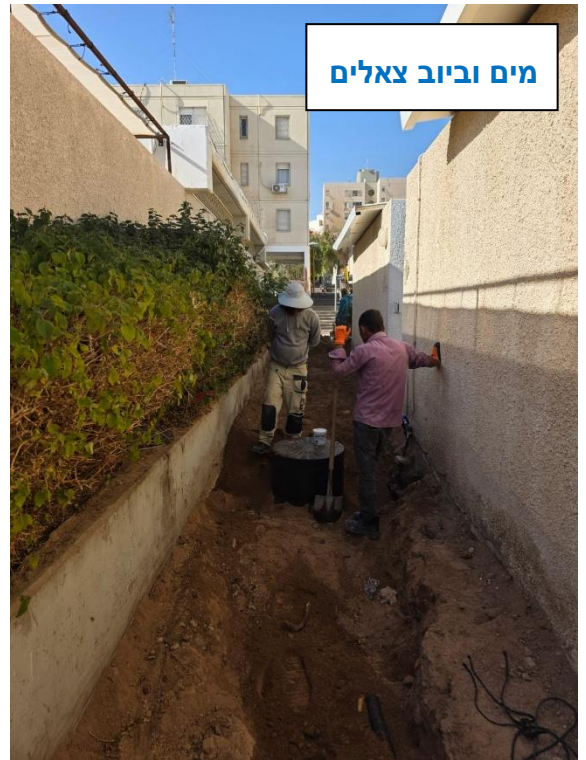
מים וביוב צאלים