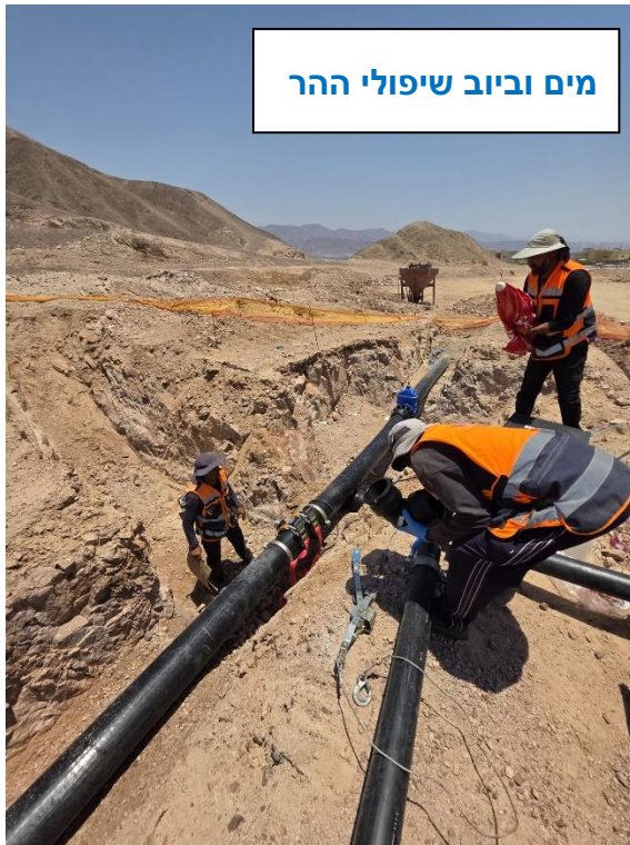
מים וביוב שיפולי ההר