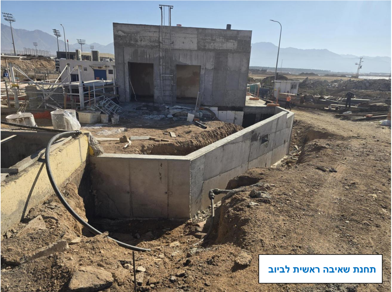
תחנת שאיבה ראשית לביוב